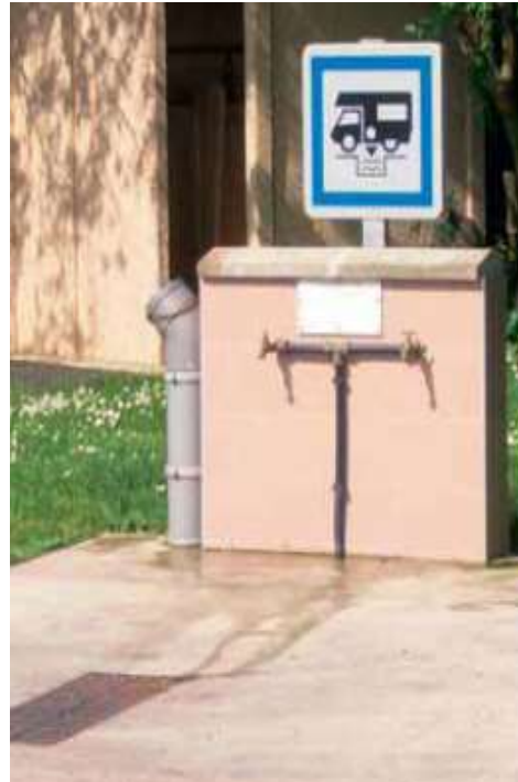
Les aires de service avec borne dite artisanale

Pour cela deux types d'aménagements sont possibles.