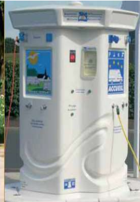
Les aires de services avec borne dite industrielle