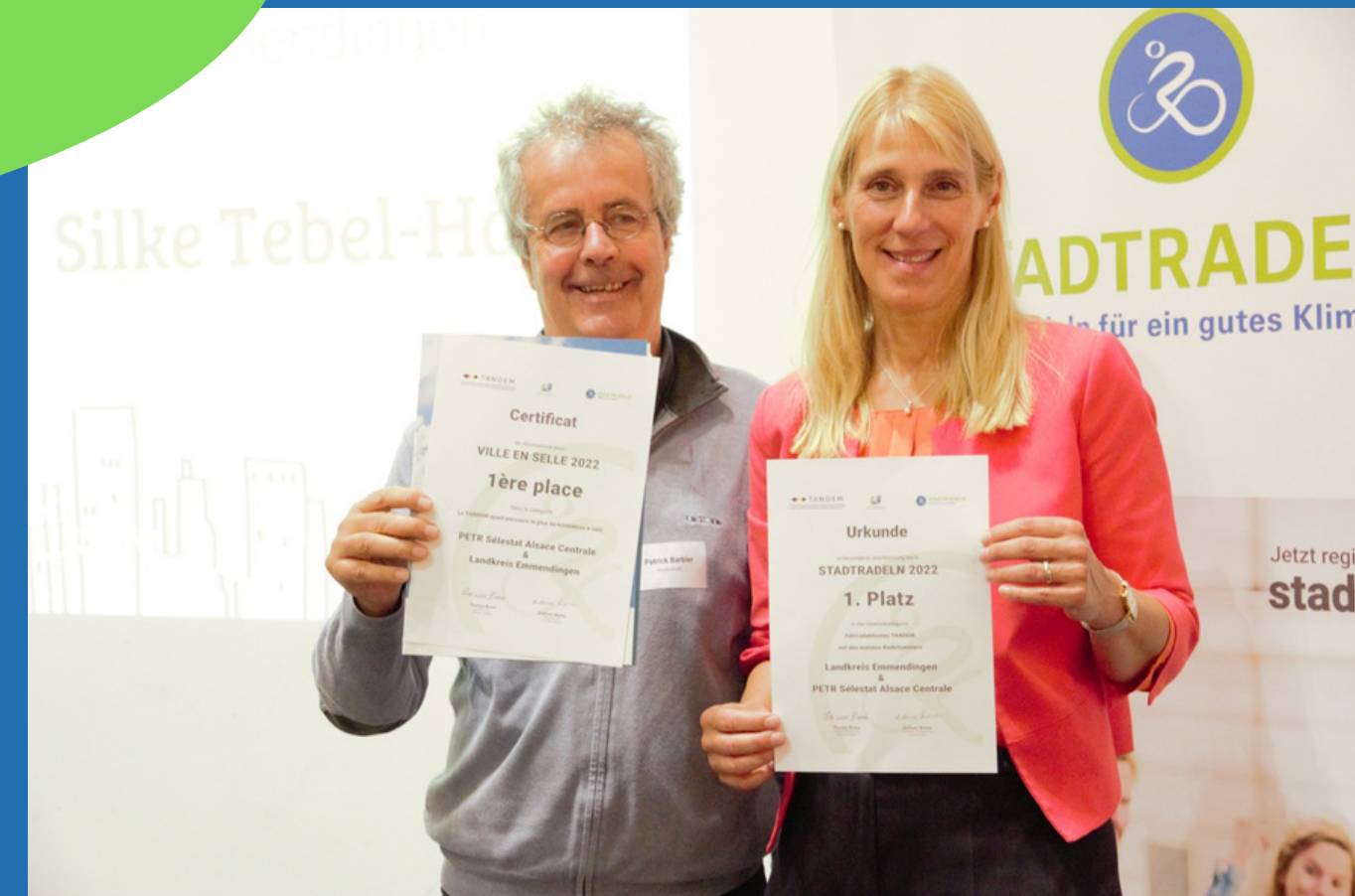
en 2022, l'Alsace Centrale et le Landkreis ont été récompensé par Ville en Selle pour leur 1ère place en tant que binôme transfrontalier