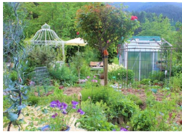
Jardins Ouverts : découvrez la programmation estivale et transfrontalière 2023 !